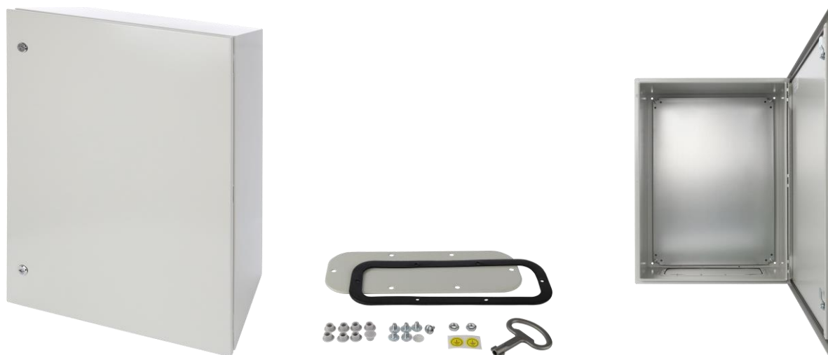
Rysunek 1. Widok obudowy.