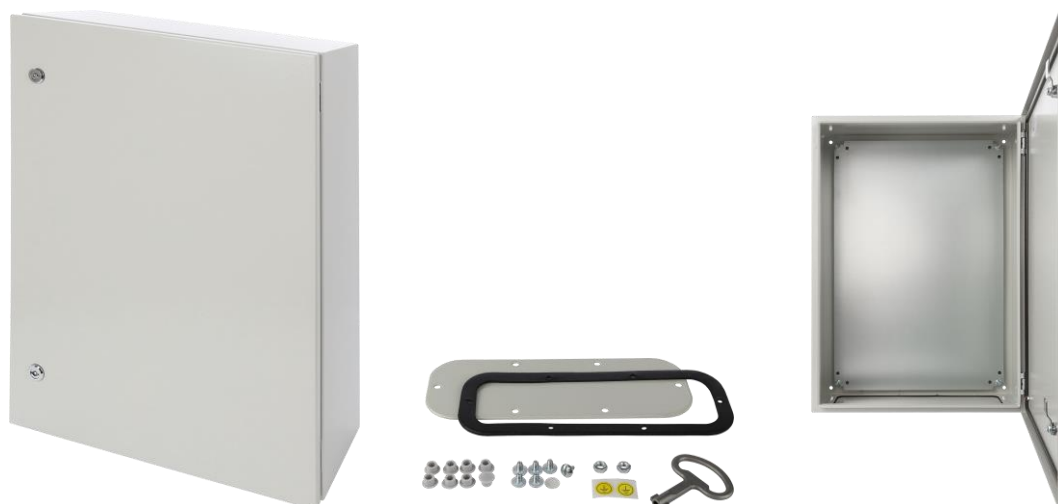
Rysunek 1. Widok obudowy.