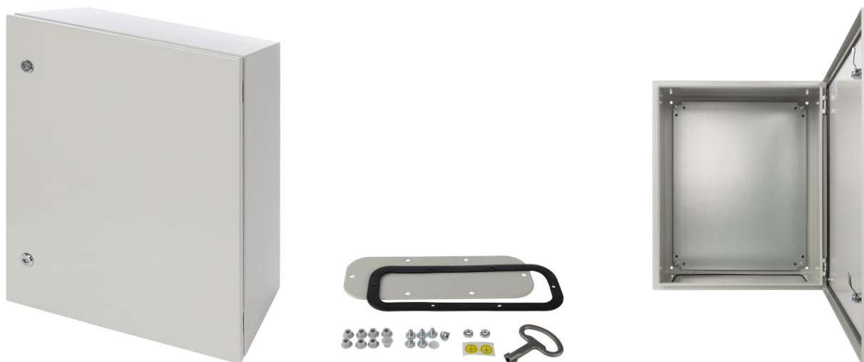
Rysunek 1. Widok obudowy.