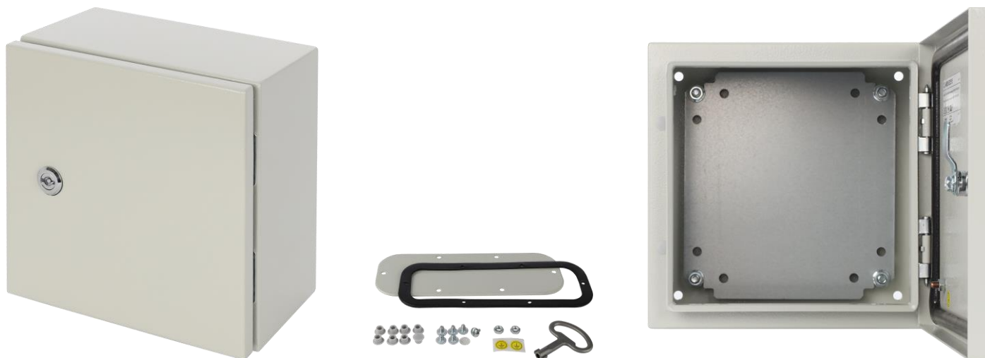
Rysunek 1. Widok obudowy.